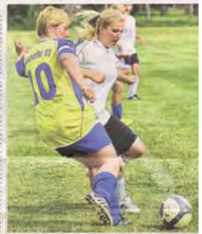
Der Gostorfer SV

(Small text column on the left side of the article, partially illegible)