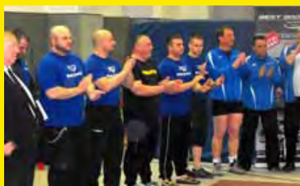
Szene während der Siegerehrung, Kampfgemeinschaft Bergen-Gostorf