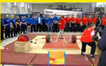
Starterfeld, Kraftdreikampf erste Bundesliga