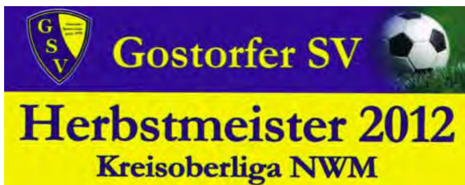
Tabellen Kreisoberliga 2012/13