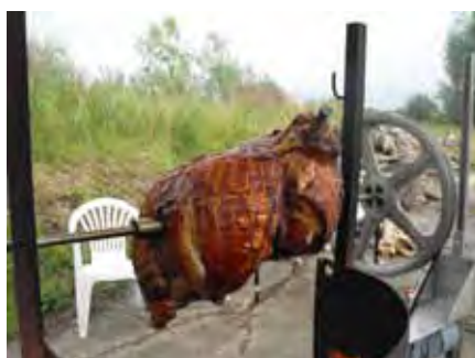
Spanferkel für die fleißigen Helfer

Es ist wohl eine Mischung aus sportlichem Erfolg, Arbeitseinsätzen und Projekten, gemeinsamen Grillabenden und Bowlingturnieren die den Reiz der Sparte ausmacht. Jedenfalls stieg die Anzahl der Mitglieder von 20 auf 31 innerhalb eines Jahres.