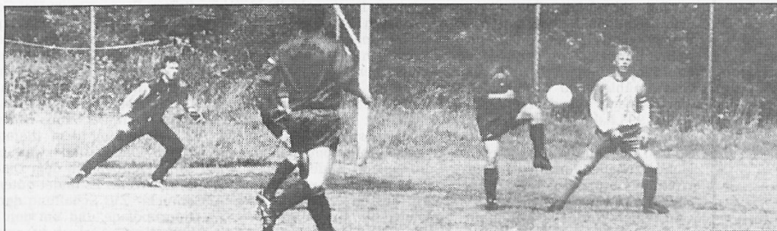
Das Kreisderby zwischen Gostorf und Klütz endete 1:1.