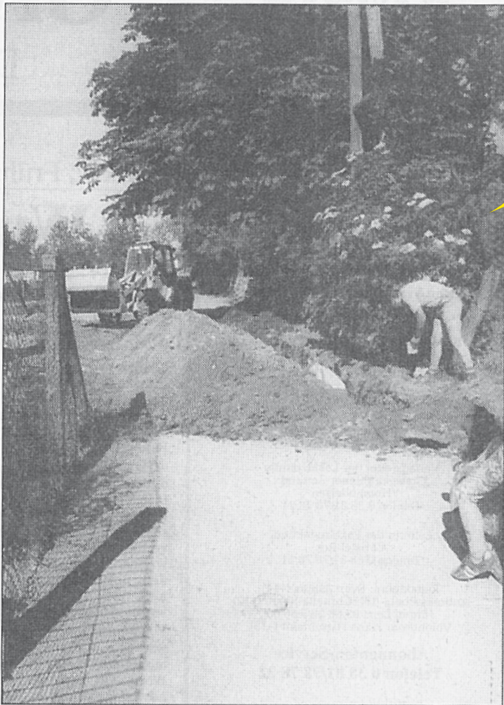
Die Zeit drängt: Bis zum 16. Juli soll die Zufahrt zum Gostorfer Sportplatz fertiggestellt sein. Dann ist ein großes Fußballereignis angesagt.